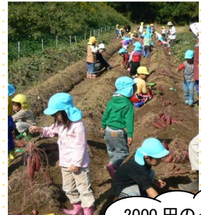
2000円のイベントになります。

■オーナー制区画とは 0.8m×6mのマルチ畝に裏面野菜を自由に植え付け、収穫することができます。植え付け、収穫のイベントはもちろん育成期間の管理（除草、間引きなど）も積極参加することで、野菜づくりの楽しさと収穫のよろこびを感じることができます。お子様の情操教育、食育の機会に是非参加をお待ちしております。